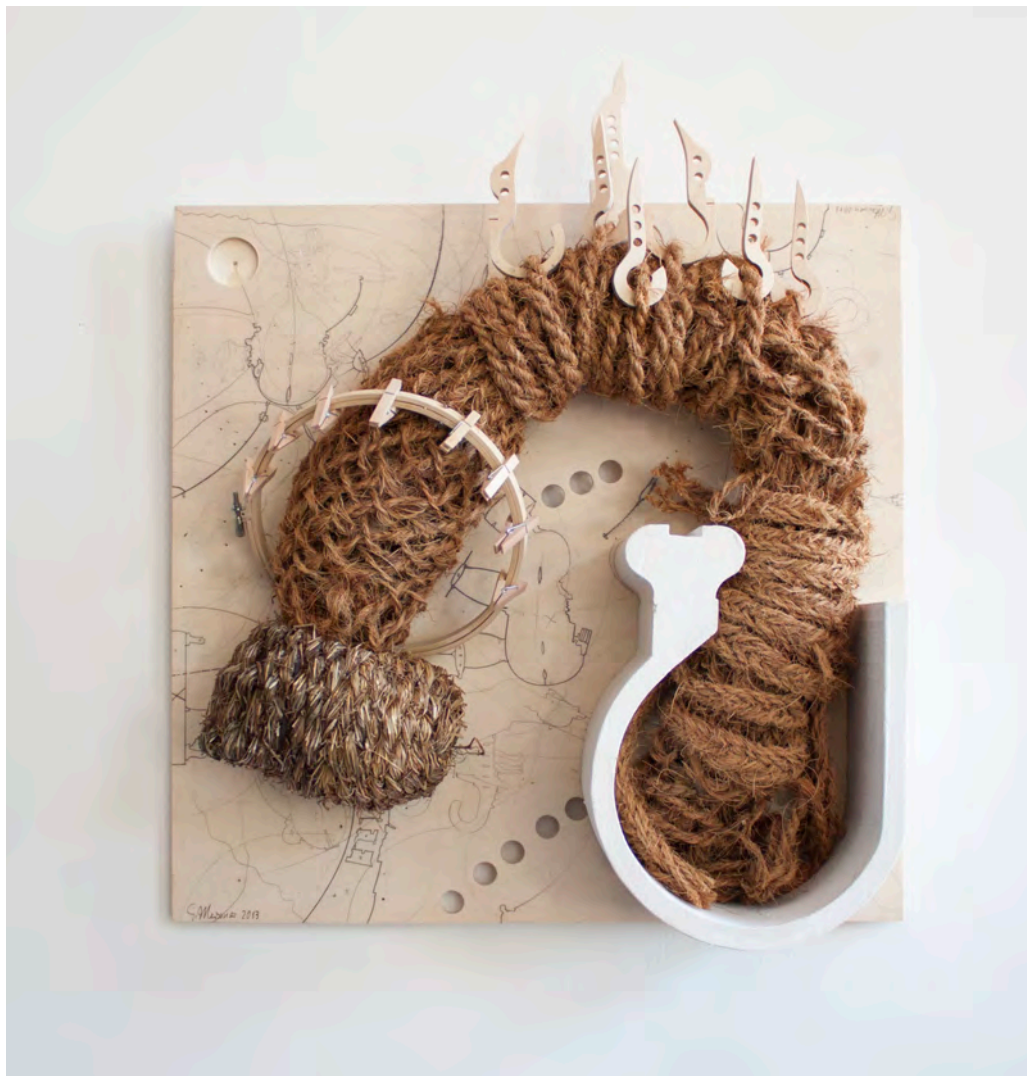
» morpha 3 « Mixed media, Stickrahmen ca. 50 x 50 x 13 cm

urzeitlich emporgetragen botschaften für erde wasser luft im kreis verschwiegen die feuerzungen göttern der xylprax vertraut samitischen schattenatmern zugeneigt