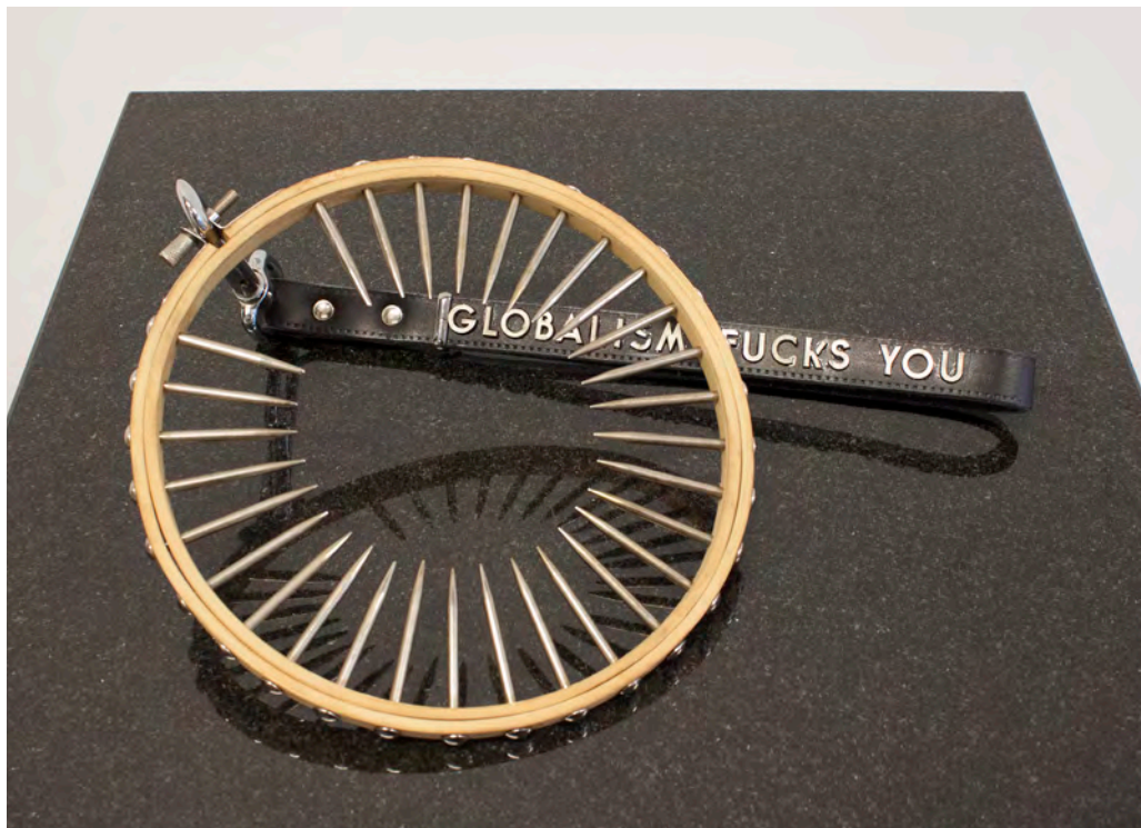
»Globalism fucks you« Leder, Metall, Stricknadeln, Stickrahmen ca. 48 x 18 x 8 cm

Als Platzhalter für diese Gesamtproblematik steht ein basales Gerät der Textilproduktion, der Stickrahmen. Er zeigt sich als Gängelband in Form eines Würgehalsbandes, bewehrt mit den scharfen Stacheln von Stricknadeln aus elektroplattierten Messing und ist mit einem Leinenkurzgriff verbunden, auf dem der Wahlspruch dieser Zeit prangt: ‚Globalism fucks you‘.