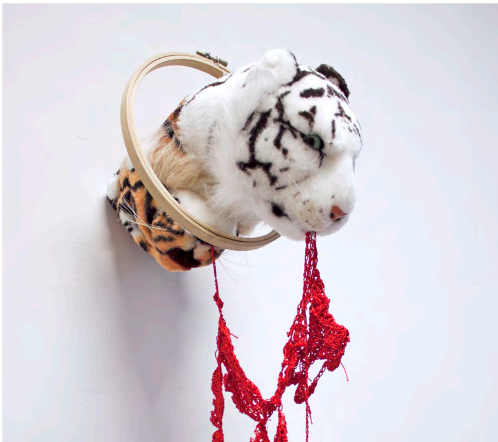
»Absurde Dressur« (Detail) Garn, Glas, Kunststoff, Stoff, Stickrahmen 25 x 25 x 50 cm