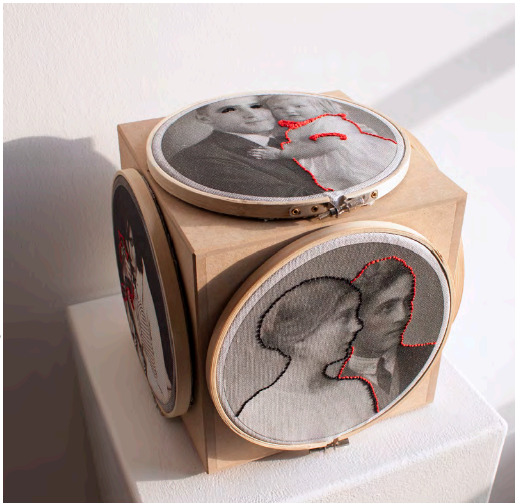
»sticking into my family affairs« Druckfarbe, Garn, Holz, Stoff, Stickrahmen ca. 22 x 22 x 22 cm (6 -teilig)

Und immer treten verborgene Wunden und Verwundungen zutage. Indem ich die Familienfotos auf Stickstoff übertrage und mit Stickgarn bearbeite, sticke und steche ich in die Wunden, in das Unsagbare der familiären Beziehungen.