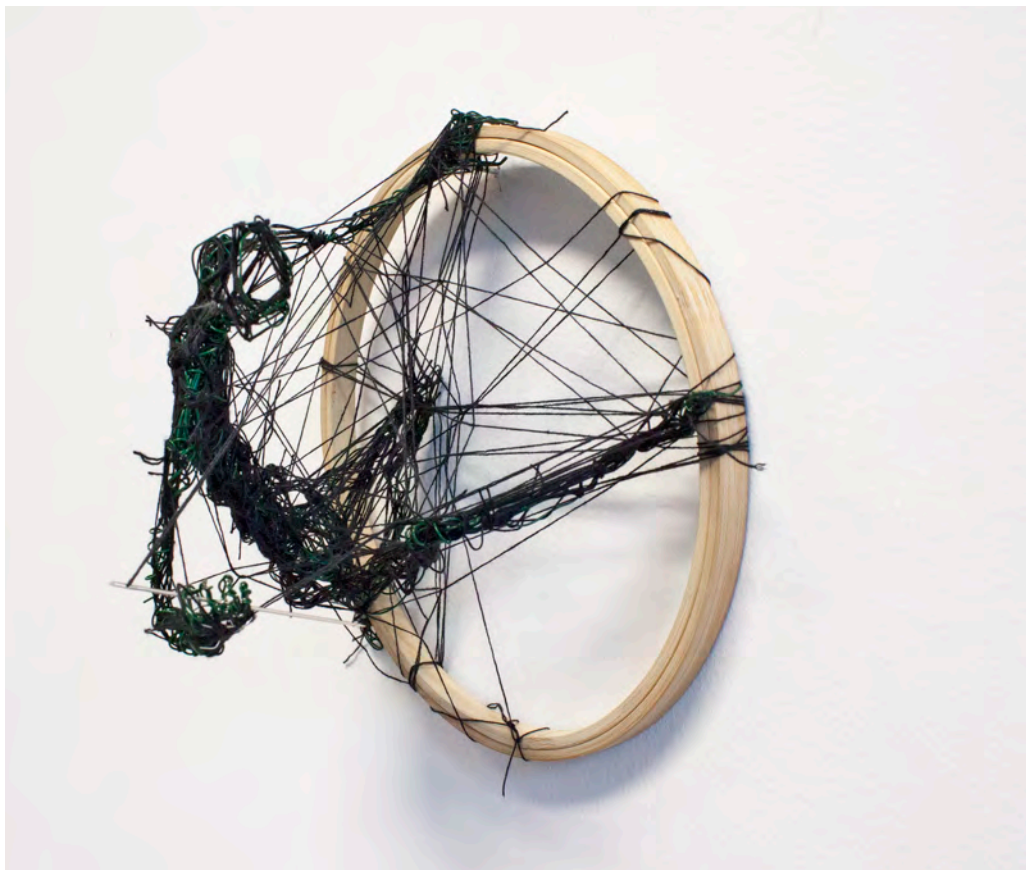
»Verstrickt« Draht, Garn, Nähnaedel, Stickrahmen ca. 18 x 18 x 15 cm

Das Leben der Angestellten besteht im Grunde nur aus Arbeit, von frühmorgens bis spätabends. Um ihre Familien ernähren zu können und auch um sich selbst am Leben zu erhalten, bleibt vielen keine andere Möglichkeit als immer weiterzuarbeiten. Das Mittel wodurch ihr Leben finanziert wird, wird so beinahe zum einzigen Lebensinhalt.