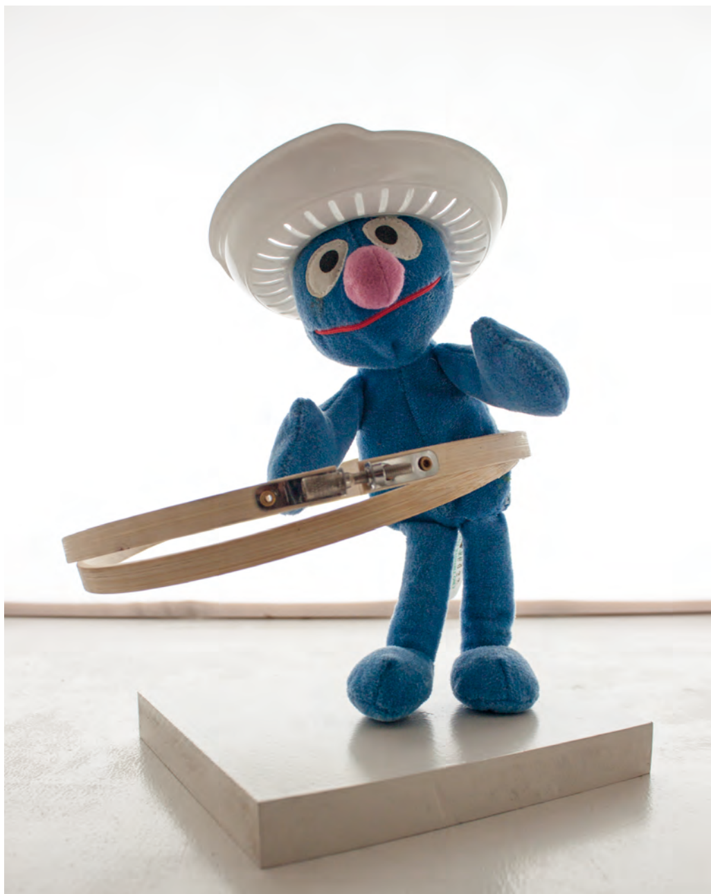
»Hula Hoop« Holz, Lack, Metall, Plastik, Stoff 18 x 20 x 26 cm

Ich dachte sofort an einen Hula Tänzer und der lag schon wie zufällig auf meinem Schreibtisch bereit.“