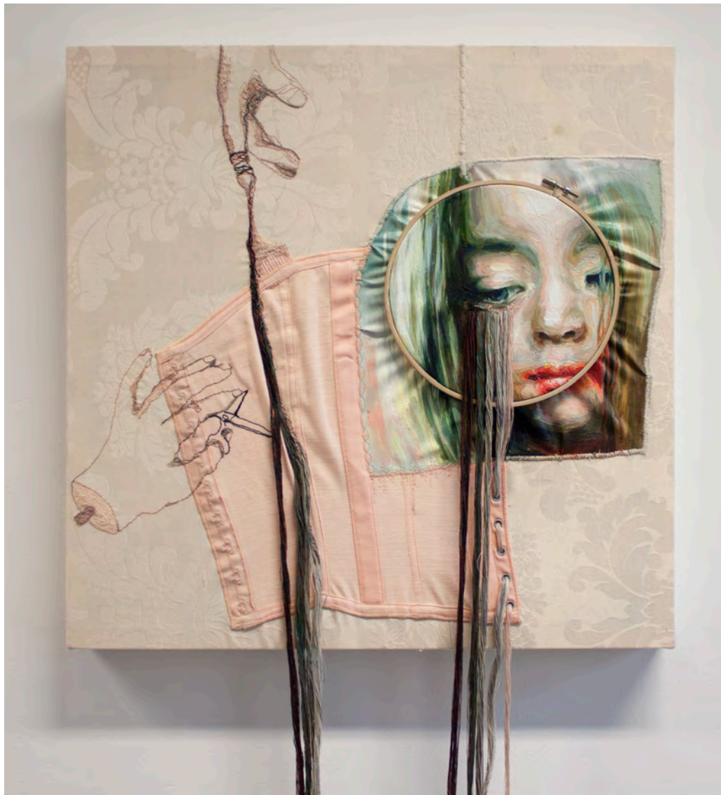
»Heal my pain« (Detail) Mixed material ca. 50 x 50 x 8 cm

In meinem Werk »Heal my pain« symbolisieren die textilen Elemente Trauer aber auch Heilung. Sie sind gleichzeitig deren Ursprung und Lösung – im Sinne der drei Moiren, die Göttinnen der griechischen Mythologie (die den Lebensfaden von der Geburt bis zum Tode kontrollieren). Das Korsett kann als Symbol der ehemaligen Frauenrolle angesehen werden.