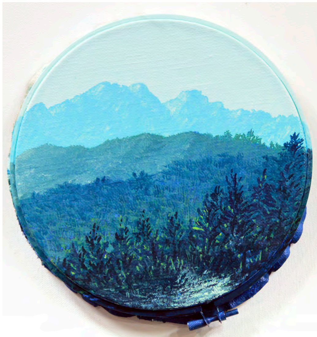
»Forest - Life« Holz, Metall, Öl auf Leinwand Ø ca. 19 cm