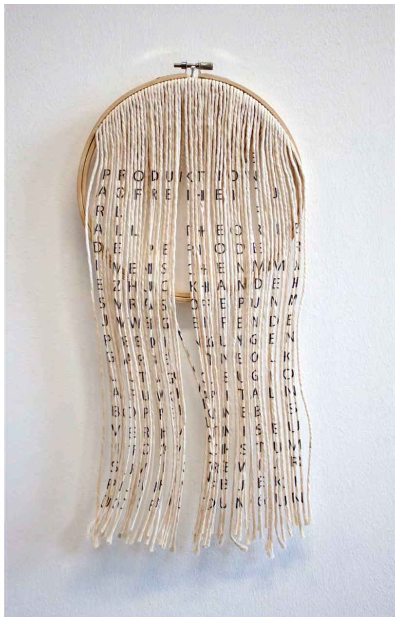
»Periode 30« UV-Direktdruck, Bindfäden, Stickrahmen ca. 20 x 40 x 3 cm

Welche Rolle heutzutage der direkte, obschon in allen Industriezweigen der aus Arbeitsmitteln bestehende Teil des konstanten Kapitals genügen, immer in demselben Verhältnis zu wachsen, hat beispielsweise die sogenannte Hausarbeit gezeigt.