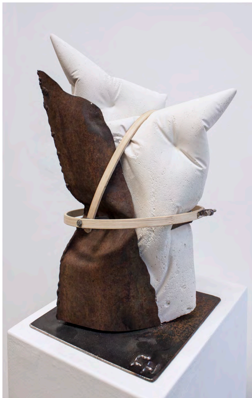
» Ohne Titel « Beton, Holz, Metall, Sandsteinmasse, Stickrahmen ca. 20 x 39 x 22 cm