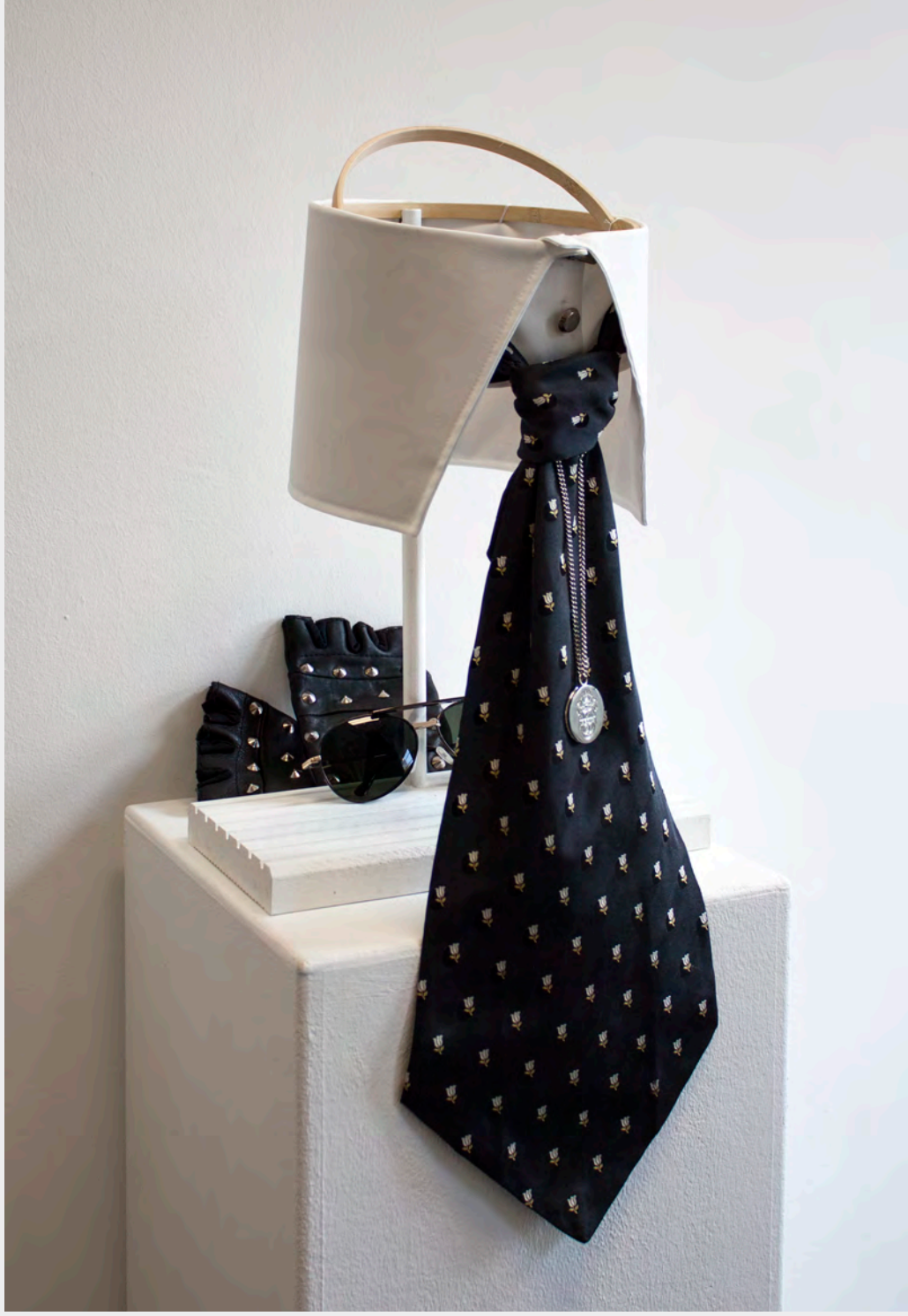
»Die Insignien des Modepapstes« Glas, Holz, Leder, Metall, Seide, Stoff, Stickrahmen ca. 30 x 50 x 25 cm (variabel)