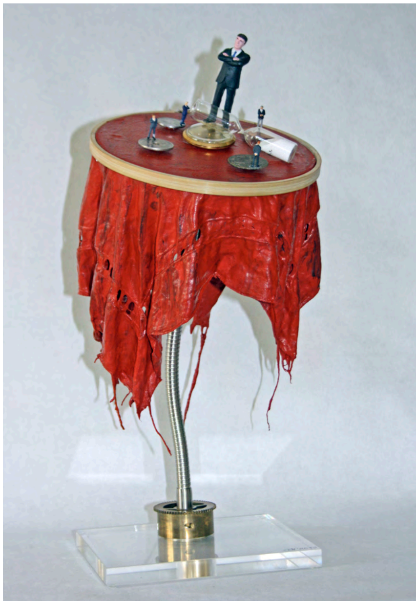
»Voiceless Slaves« Holz, Metall, Ölfarbe, Plastik, Plexiglas, Stoff ca. 22 x 30 x 25 cm

Die sich drehenden Münzen auf dem Stoff repräsentieren die globalen Finanzmärkte, immer mehr Profit, immer billigere Produktion auf Kosten der Humanität. Auch wir als Konsumenten (Schnäppchenjäger) beteiligen uns an den Arbeitsbedingungen und Missständen der ‚voiceless slaves‘.